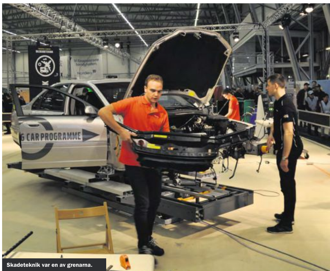
Skadeteknik var en av grenarna.

– Många elever vill inte ha så mycket teoretiska ämnen, utan de vill koncentrera sig på yrkesämnena. Jag kan tycka att det kanske är för mycket för en del elever med att läsa både svenska, matematik och engelska vid sidan om yrkesämnena. De teoretiska ämnena kan man alltid läsa in i efterhand. Det är inte alls så farligt som det låter. Jag tycker det är bättre om yrkes elever får möjlighet att koncentrera sig på att bli bra i sina yrken, så att de blir anställningsbara. Det andra kan de alltid lära sig i efterhand. ○